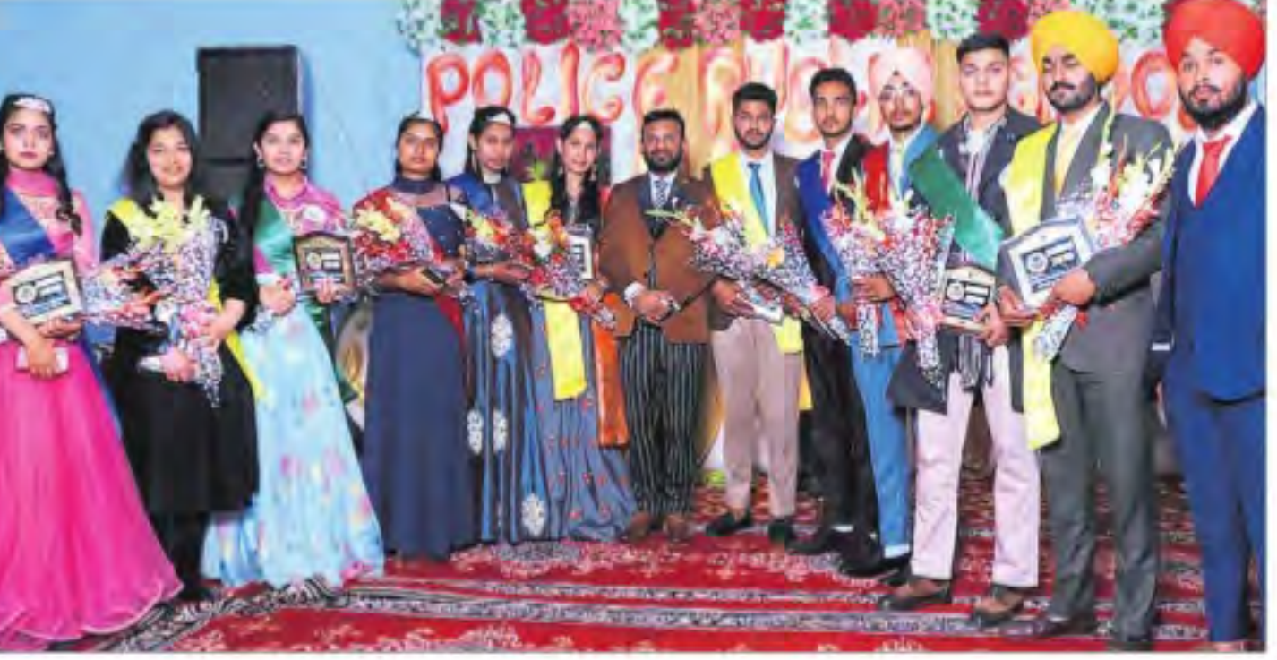
Students and staff of Police Public School during the farewell party in Mansa on Saturday.

PPS organises farewell party for classes X, XII students